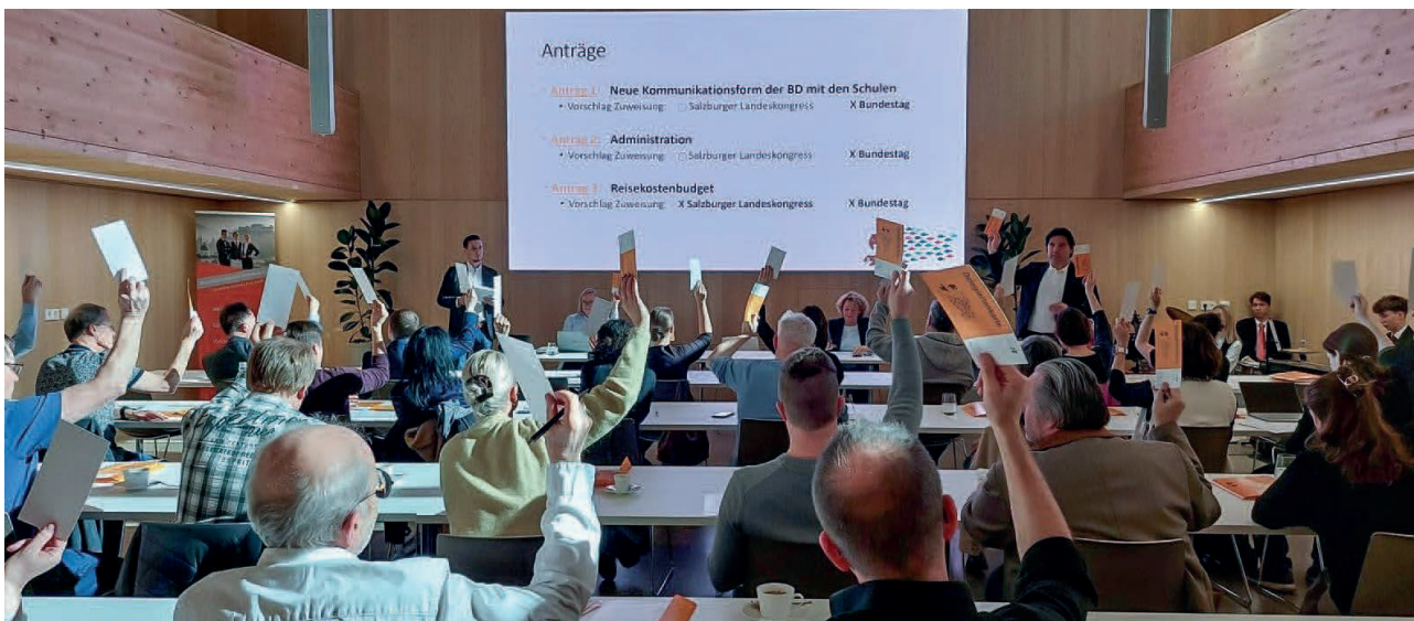
Die Kolleg:innen der Landesleitung 14 bei der Abstimmung

Am 25. Februar 2026 fand in der Tourismusschule Klessheim der Landestag der Gewerkschaft Öffentlicher Dienst, Landesleitung BMHS-Salzburg, statt.