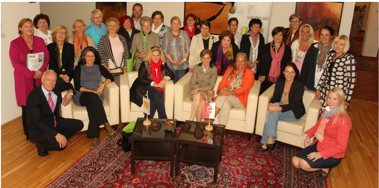
Bildtext: Frauenpower in Salzburg