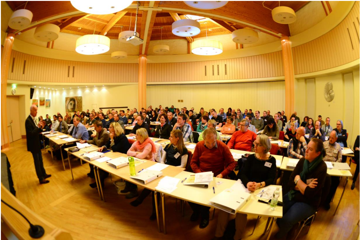
Bildtext: Interfraktionelle Seminare – ein wichtiger Bestandteil unserer Bildungsarbeit